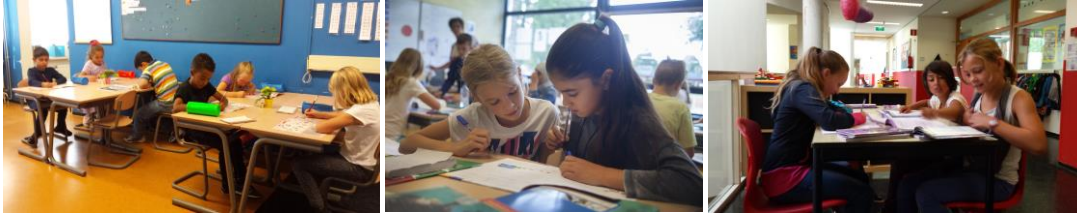
(Op de foto's een kijkje in groep 3, groep 7 en leerlingen van groep 5 aan het werk op de gang)